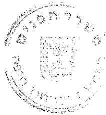
פאיו חנא, רו"ח הממונה על מחוז חיפה

וזאת על פי הפירוט שבנספח א*, המהווה את תמצית התקציב המפורט.